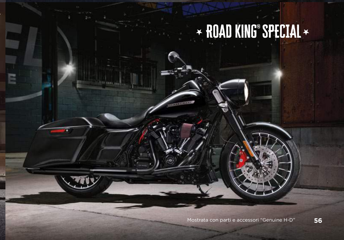
ROAD KING® SPECIAL