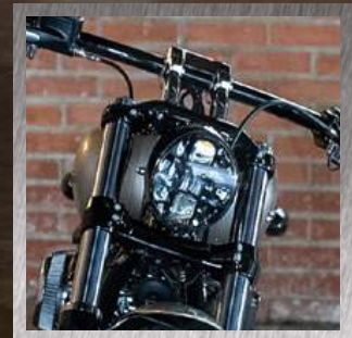
FARO A LED DAYMAKER®