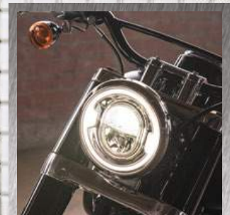
FARO A LED DAYMAKER®