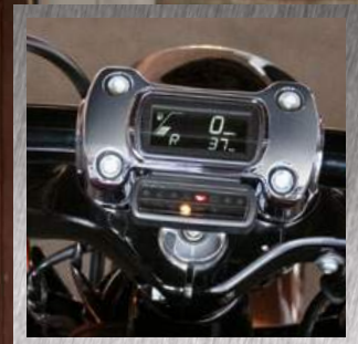
COMANDI DIGITALI SUL MANUBRIO

Il nuovissimo modello Breakout® riprende il concetto di vigoria in grado di divorare l'asfalto e lo rielabora in chiave moderna. Il nuovo serbatoio, più piccolo, permette al motore Milwaukee-Eight® di risaltare come un bicipite in trazione. Lo pneumatico posteriore da 240 mm sembra nato per lasciare un grosso solco sull'asfalto. Le nuovissime sospensioni ti consentiranno di liberare la massima potenza su strada. E sentirai la differenza dei 14 chilogrammi in meno nell'istante in cui darai gas. Inoltre, resterai stupito dall'angolo di piega e dall'agilità di questa moto che conserva sempre un'attitudine e uno stile dragster. Scatena tutta la sua potenza al prossimo semaforo. E lascia tutti a bocca aperta. Disponibile nelle cilindrata 107 e 114.