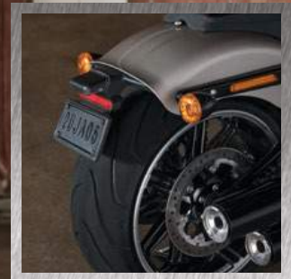
PNEUMATICO POSTERIORE DA 240 MM