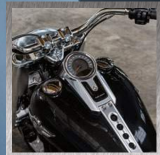
NUOVA CONSOLE SERBATOIO

Il look del Fat Boy® è più vigoroso che mai, grazie ai nuovissimi cerchi lenticolari, allo pneumatico posteriore da 240 mm e a quello anteriore da 160 mm. Aggiungendo le finiture con cromatura satinata mozzafiato e la caratteristica illuminazione anteriore a LED, il risultato sarà un look in grado di stupire ancora di più rispetto alla prima motocicletta Fat Boy® realizzata. Il nuovo Fat Boy® pesa 13 chili in meno. Sentirai la differenza la prima volta che lo solleverai dal cavalletto laterale. Se a tutto questo si unisce la maggiore potenza del motore V-Twin Milwaukee-Eight®, si può immaginare cosa sprigionerà quando il semaforo diventa verde. Azionare l'acceleratore del Fat Boy® sarà un'esperienza elettrizzante. Perché, sotto sotto, è un tripudio di muscoli. Disponibile nelle cilindrata 107 e 114.