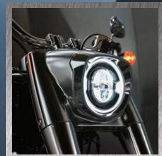
FARO A LED DAYMAKER®