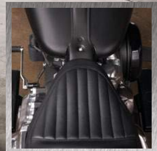
SELLA TUCK & ROLL

L'idea di fondo dei bobber è sempre stata quella di ridurre all'essenziale e potenziare la moto per una guidabilità più entusiasmante. Il nuovissimo Softail Slim® è la perfetta rappresentazione di quest'idea. Pesa 15 chili in meno rispetto al modello dell'anno precedente. È più potente, ha un maggiore angolo di piega e sospensioni anteriori e posteriori rinnovate. Così, avviando il motore Milwaukee-Eight® 107, puoi andare a divertirti sulle tue curve preferite. Il look è in perfetto stile bobber, come solo Harley-Davidson sa fare. Provalo tu stesso. Ti porterà indietro nel tempo. Ma ti farà fare anche tanta strada. Molto velocemente.